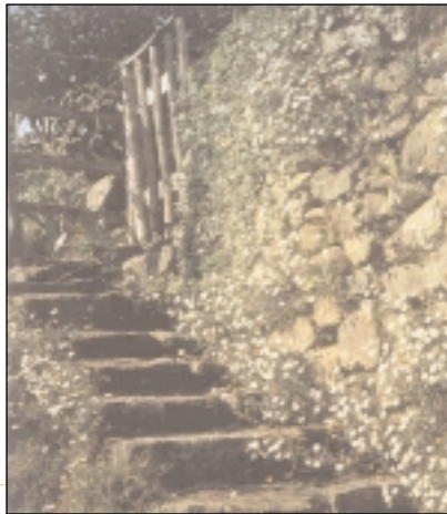
Muret de pierres sèches, escalier et érigérons, Villargein, vallée de Bethmale