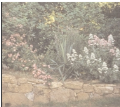
Muret de pierres sèches, Valérianes et rosier ancien, Bordes sur Lez