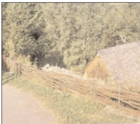
Clôture réalisée en perches de noisetier, Le Playras, vallée du Biros

A partir de ces bases, le jardin peut évoluer en intégrant judicieusement d'autres éléments.