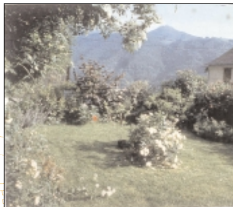
Clôture de grillage et haie libre à base d'arbustes à fleurs, Villargein, vallée de Bethmale