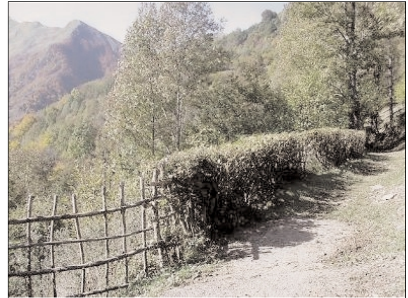
Portail bois et haie de noisetiers taillés, Le Playras, vallée du Biros