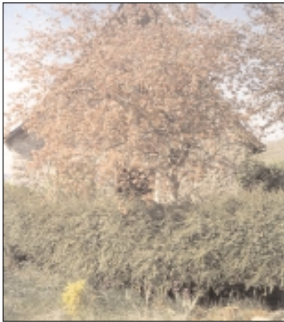
Pommier à fleurs, Arrien, vallée de Bethmale