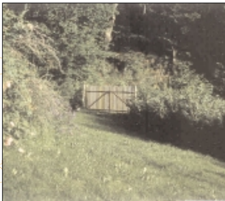
Clôture de grillage, haie de groseillers et portail en bois, Bordes sur Lez