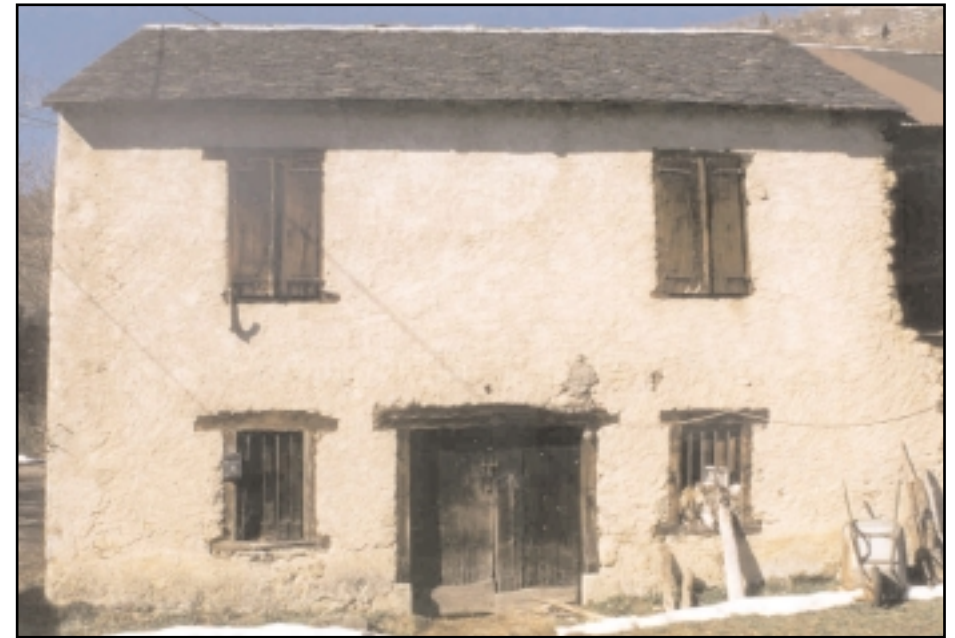
Hameau Les Eycharts Vallée de l'Arac

Ce dispositif fait partie de l'identité du bâtiment en tant que système constructif et non comme élément de représentation . Vouloir à tout prix le remettre à nu relève donc d'une mauvaise appréciation de l'authenticité et oblige en outre à une application partielle de l'enduit qui formera des bourrelets disgracieux à la jonction bois/remplissage comme sur la photo ci-contre (voir fiche sur les élévations légères).