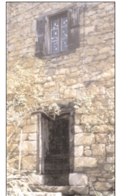
Habitation à Ayet, vallée de Bethmale (à gauche), à Irazein, vallée du Biros (à droite)