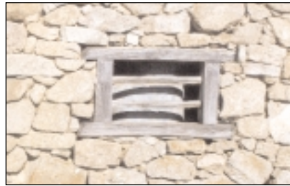
Fenêtres de granges, à gauche à Uchentein, à droite à Cominac,.