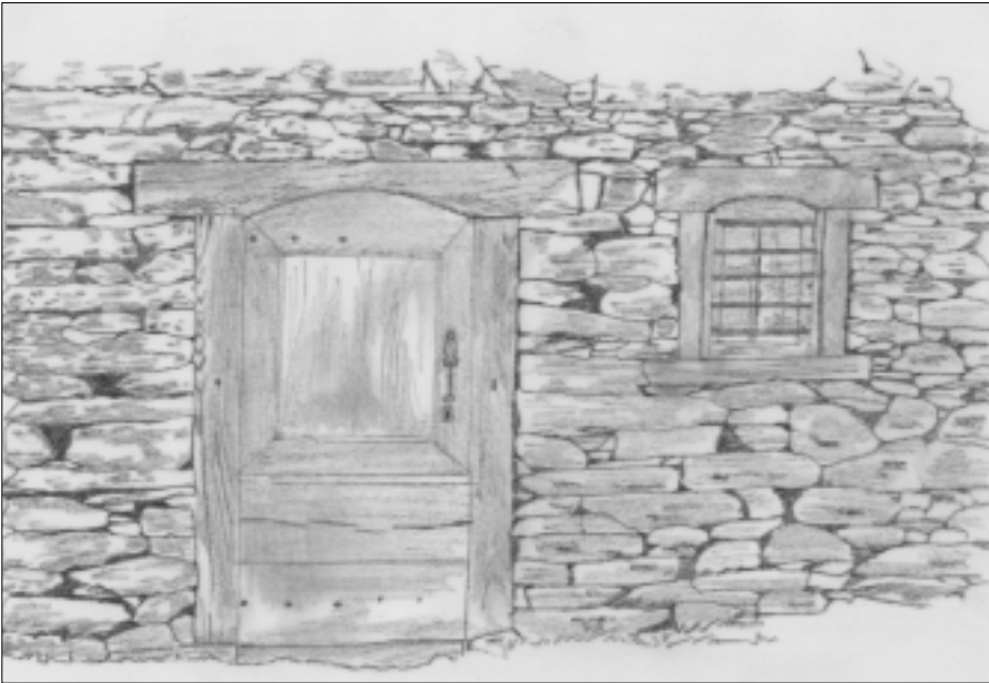
Linteaux de porte et de fenêtre taillés, Luentein, Vallée du Biros