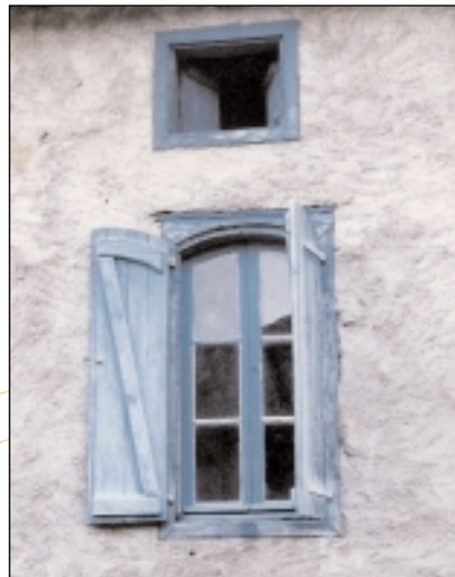
Porte fenière de grange, vallée du Biros (à gauche), fenêtre à linteau cintré à Ercé