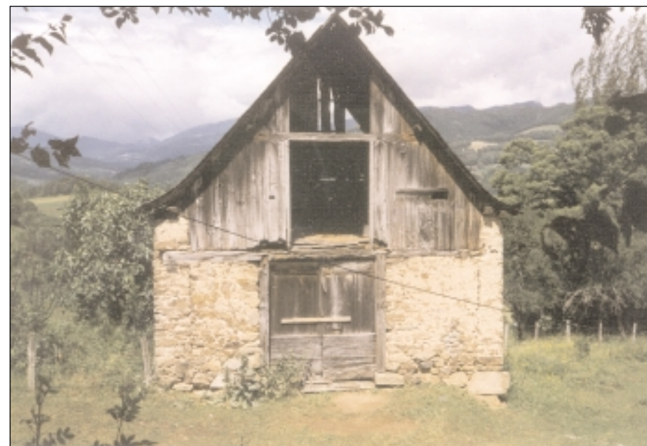
Grange à Cescau