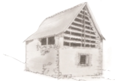
le bois et le verre