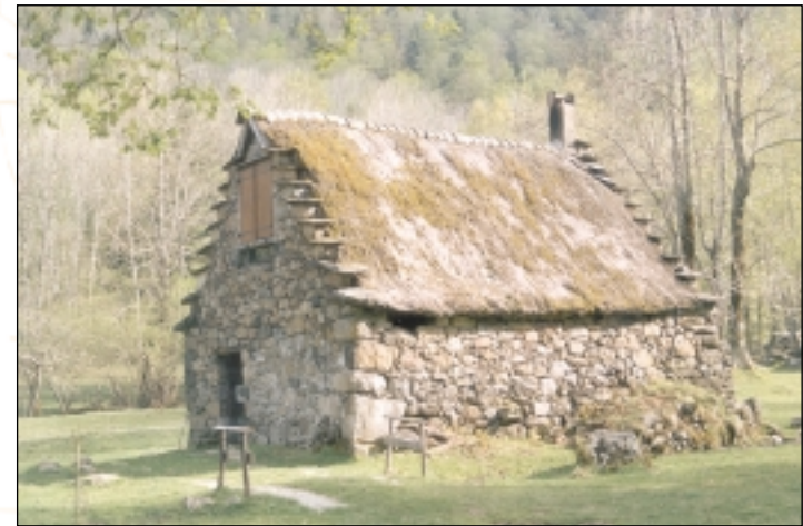
Grange à Saurat