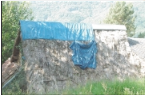
Toiture de grange à Saurat (Fantillou)

Le propos n'est pas d'imaginer un retour à ce système constructif mais simplement d'éviter sa disparition totale.