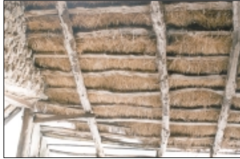
Détail de charpente

De nos jours, plus personne ne cultive de seigle comme matériau de couverture, car le chaume ne pourrait résulter que de cultures et de techniques de ramassage spécifiques. En effet, le seigle, l'orge ou le blé pour les espaces montagnards, le genêt et le roseau pour d'autres sites géographiques (Camargue, Haut Vivarais...), doivent être taillés en gerbes de 1.20 m à 1.40 m, ce qui n'est possible que manuellement.