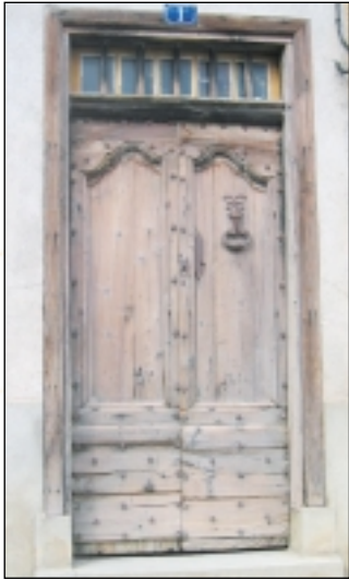
Porte d'entrée à Saurat