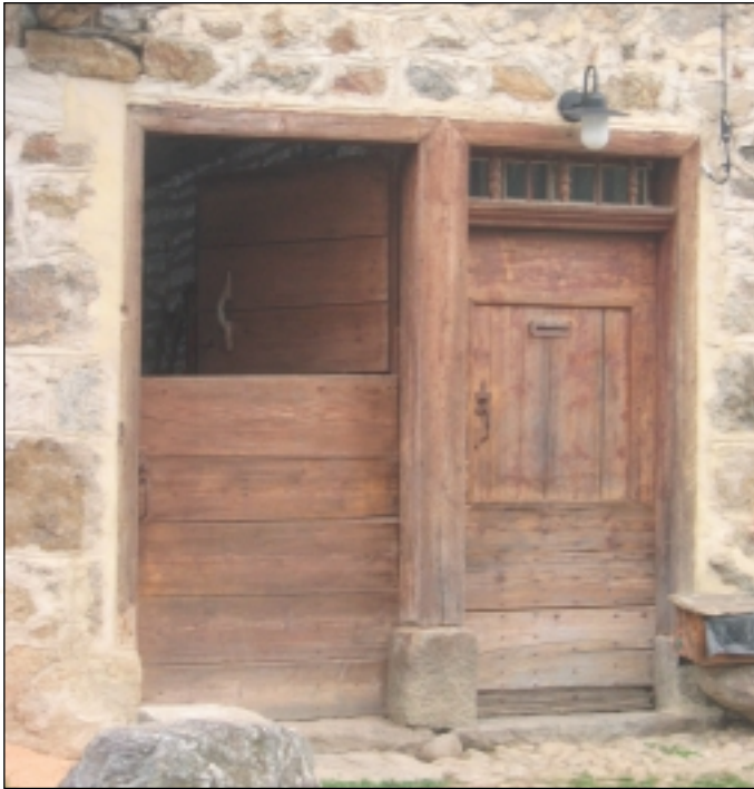
Porte d'entrée à une habitation mitoyenne avec celle d'une grange à Saurat (Prat Communal)