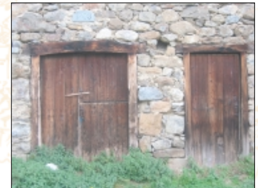
Porte de grange et d'habitation à Saurat (Prat Communal)