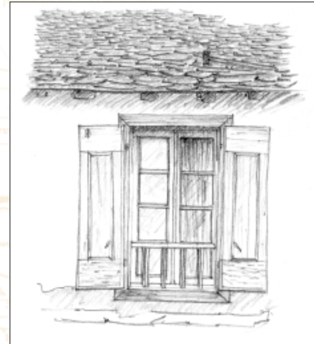
Fenêtre à Ascou (Le Pujal)