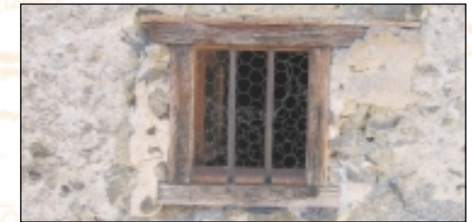
Fenêtre de grange à Mijanès