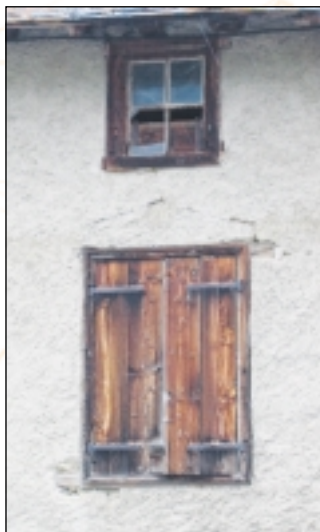
Fenêtres à Montaillou