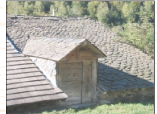
Porte fenière de grange à Ascou (Goulours)