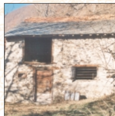
Grange à Verdun