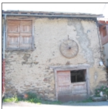
Grange à Ascou (Le Pujal)