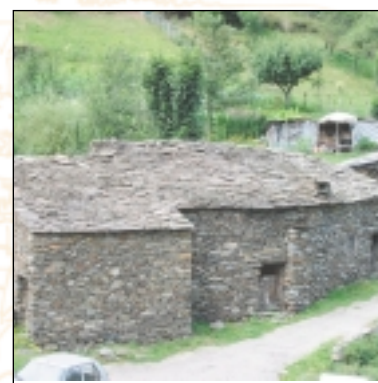
Granges à Auzat