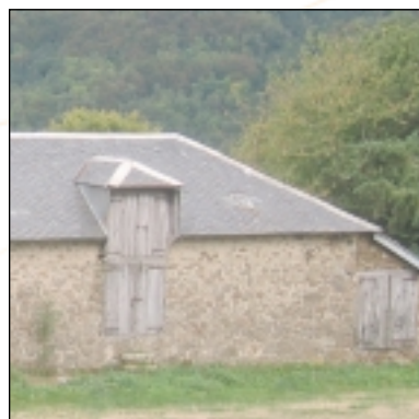
Grange à Freymène

La porte d'accès pourra recevoir un vitrage en partie haute, éventuellement occulté par un volet "haut".