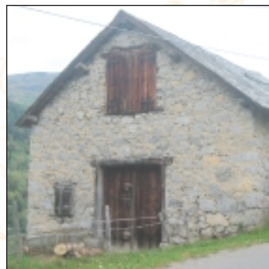
Grange à Saurat (Prat communal)