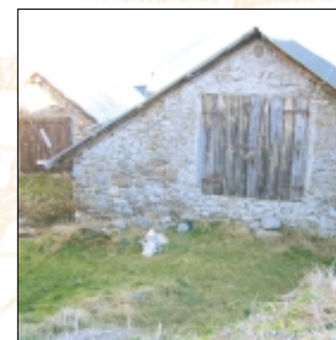
Granges à Lapège