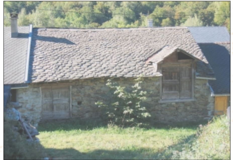
Grange à Ascou (Goulours)

Les volumes élémentaires refermés sur eux mêmes supportent assez mal d'être étendus ou surélevés. Il faut éviter de créer des "verrues" sur ces volumes sobres.