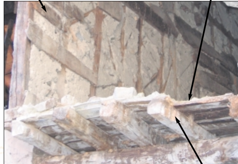
Vue sur le plancher d'une habitation en ruine

platelage de branches ou de planches brutes