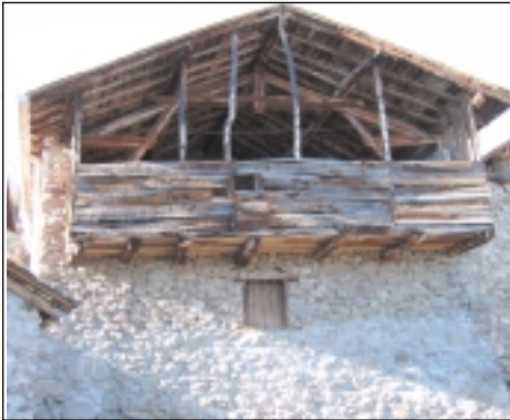
Le plancher avançant sur le pignon permet d'augmenter le volume du fenil, Lapège

Le plancher du fenil est constitué de planches ou d'un platelage de petits rondins en branches de hêtre ou de noisetier. Il repose à la fois sur des poutres de forte section et sur un décrochement de mur d'environ 10 cm.