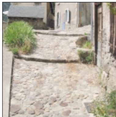
Pavage d'une ruelle avec des pierres locales, Lapège à gauche, Suc et Sentenac à droite.