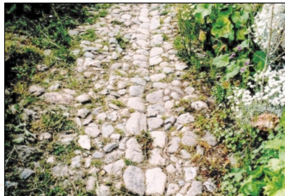
Ruelle pavée avec caniveau central